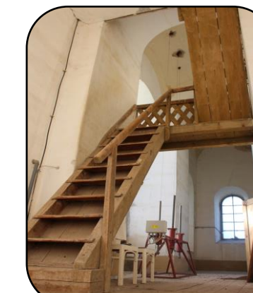
Schody na vežu