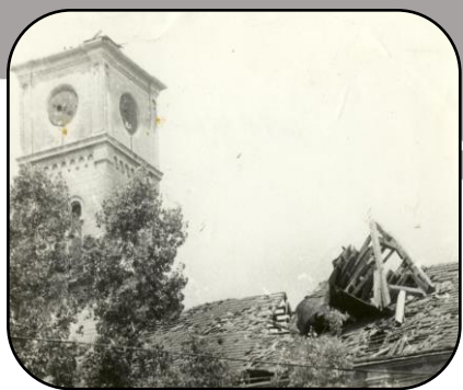
Veterná smršť 19.7.1978