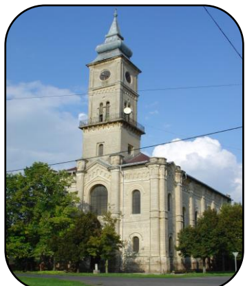
Podoba kostola v súčasnosti