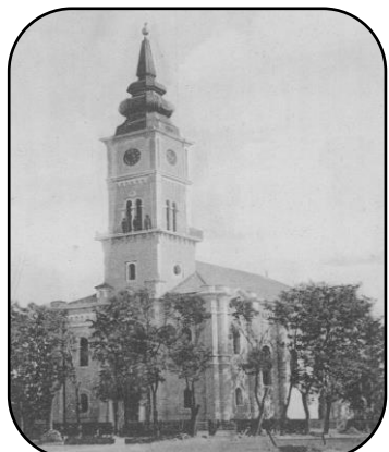
Podoba kostola v 40. rokoch 20. storočia