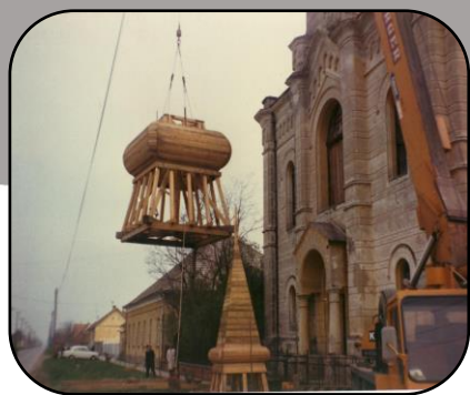
Oprava veže 25.4.1982