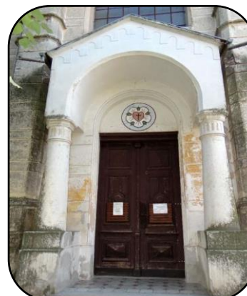
Hlavné vchodové dvere