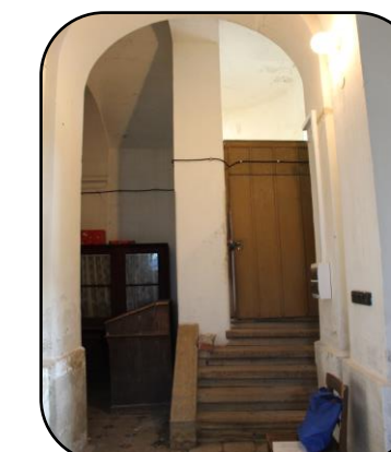
Schody na vežu