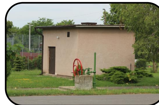
Artézska studňa, v pozadí budova vodárni