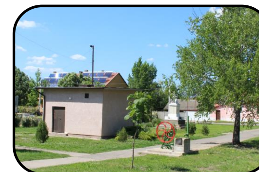
Artézska studňa, v pozadí pamätník obetiam vojny