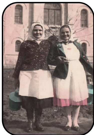
Dievčatá s „kantami“, pred kostolom