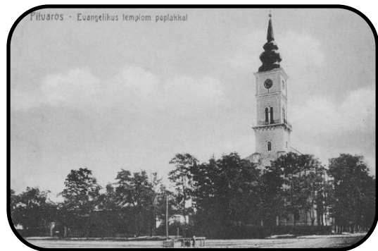
Artézska studňa pred kostolom na pohľadnici z roku 1918