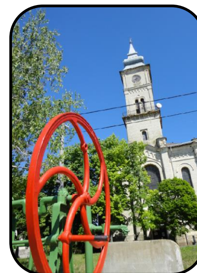
Artézska studňa, v pozadí kostol