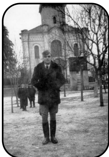
Pitvarošan pred studňou a kostolom