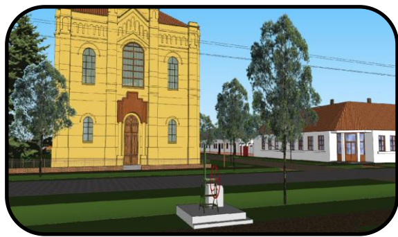
Artézska studňa pred kostolom, počítačový model