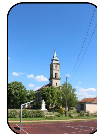
Pohľad na súčasné centrum Pitvaroša