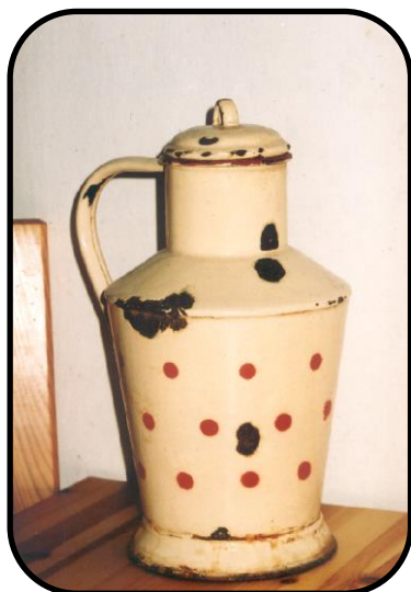
„Kanta“ na artézske vody