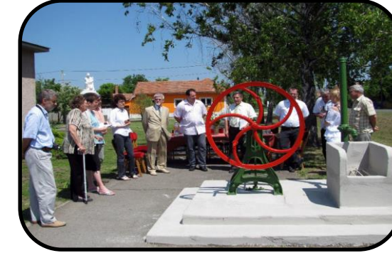
Zrekonštruovaná studňa na slávnosti 27. mája 2011