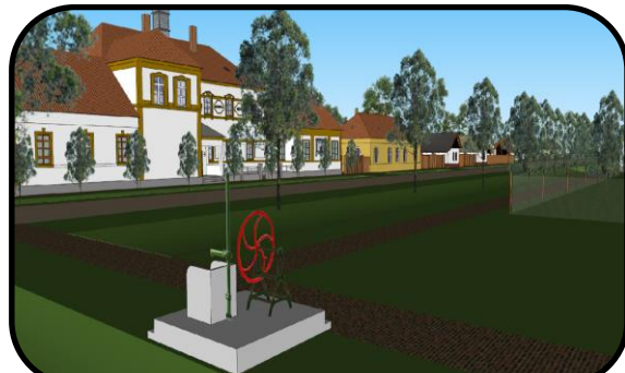
Artézska studňa, v pozadí škola, počítačový model