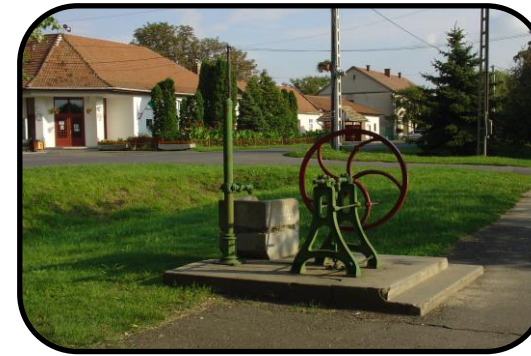
Artézska studňa v roku 2005, v pozadí obecný dom