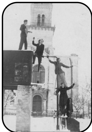
Technické zariadenie studne v polovici 40. rokov