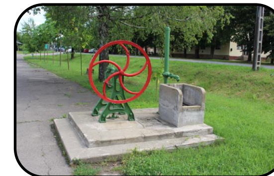
Detail na artézske studňu, rok 2016