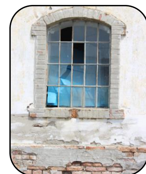
Okno na mlyna, detail, rok 2016