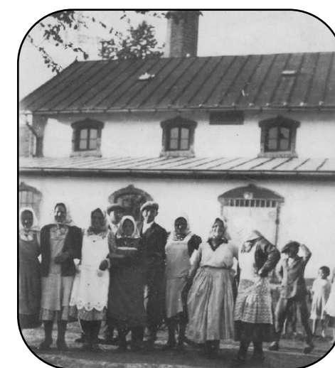
Pitvarošania pred mlynom, začiatok 20. storočia