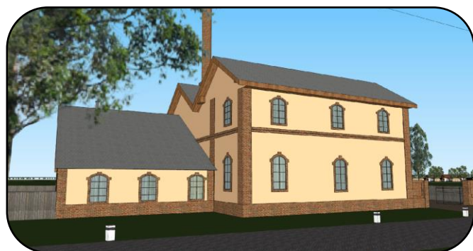
Podoba mlyna v polovici 20. storočia, počítačový model