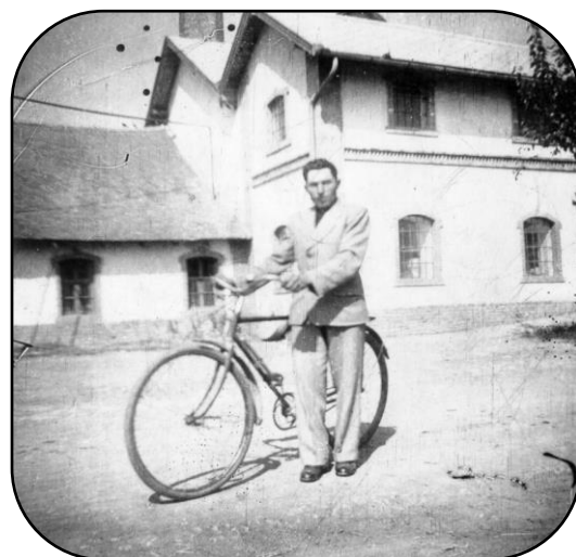
Podoba mlyna s dvojitou strechou v polovici 20. storočia