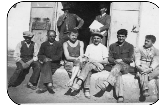
Pracovníci mlyna v roku 1940