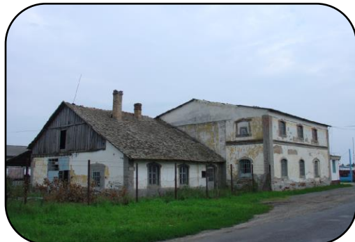
Podoba mlyna od Albertu v roku 2005