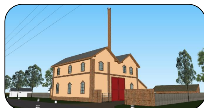
Podoba mlyna v polovici 20. storočia, počítačový model