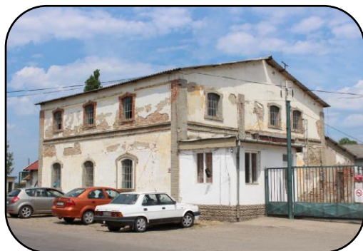
Podoba mlyna od Pitvaroša v roku 2016