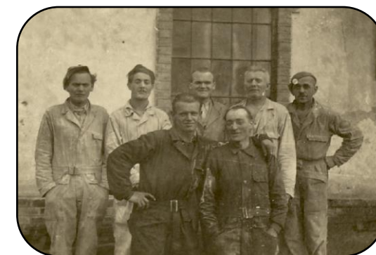
Pracovníci mlyna v roku 1947