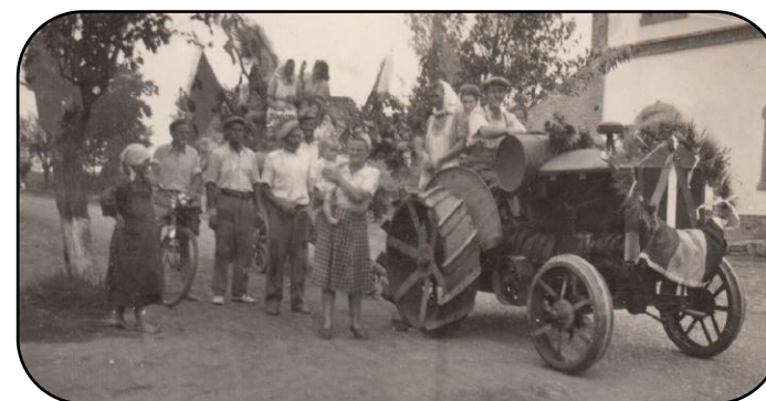
Pitvarošania pred mlynom, polovica 20. storočia