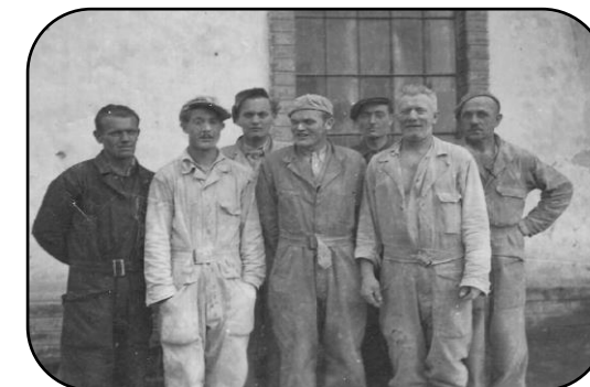
Pracovníci mlyna po roku 1947