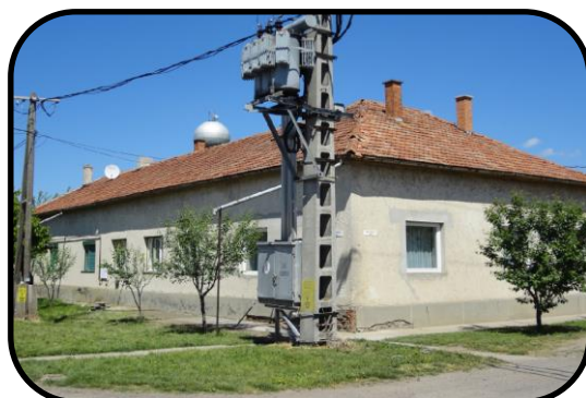
Budova starej pošty v súčasnosti, pohľad z Tretaj ulice