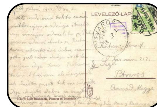
Pohľadnica adresovaná na Pitvaroš, 31.8.1914