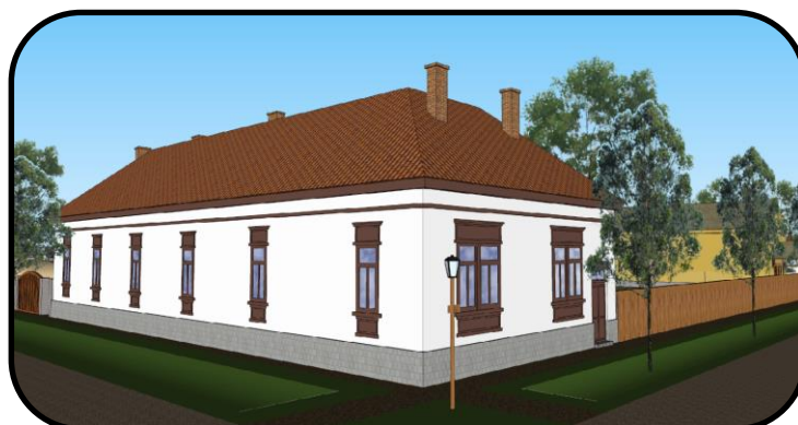
Budova pošty na rohu Tretaj a Kostolnej ulice na začiatku 20. storočia, počítačový model