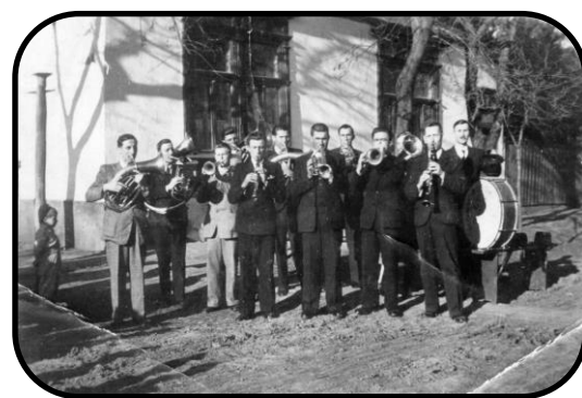
Hudobníci apoštolskej viery pred poštou v roku 1946