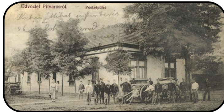
Budova pošty na dobovej pohľadnici, začiatok 20. storočia