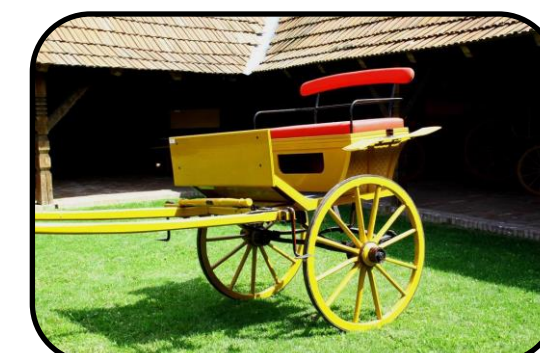
Taliga v Szatmárskom múzeu v Maďarsku