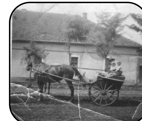
Poštársky voz („taliga“) na Pitvaroši v roku 1936