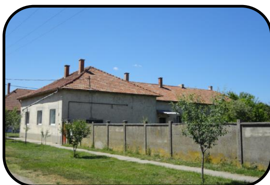
Budova starej pošty v súčasnosti, pohľad z Kostolnej ulice