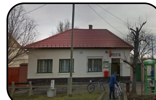
Súčasná budova pošty na Kossuth Lajos utca