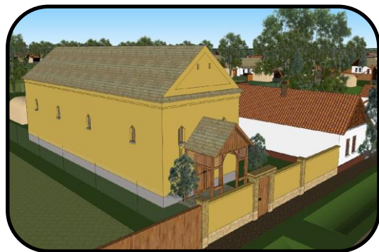
Modlitebňa verícich v minulosti, počítačový model