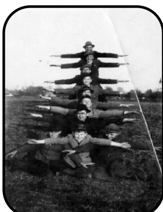
Mládež na paži v roku 1936