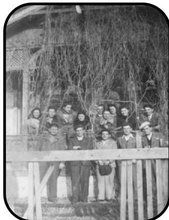
Veríci pred modlitebňou