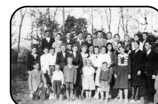
Stretnutie verícich u Kochanov (40. roky)