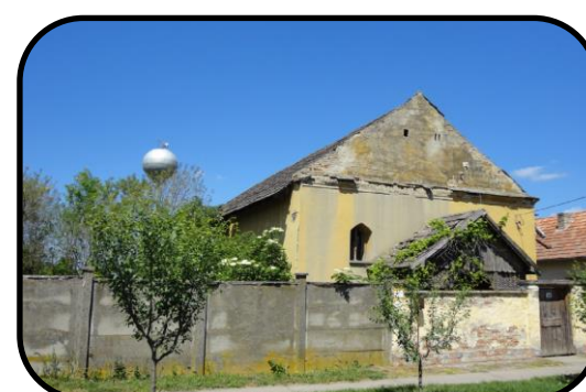
Priečelie modlitebne v súčasnosti