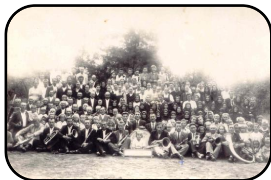
Zhromaždenie verícich (40. roky)