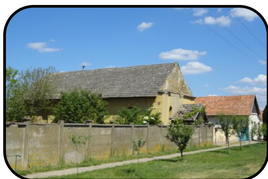
Budova modlitebne v súčasnosti