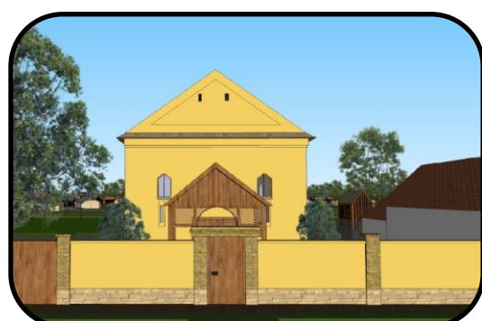
Priečelie modlitebne, počítačový model