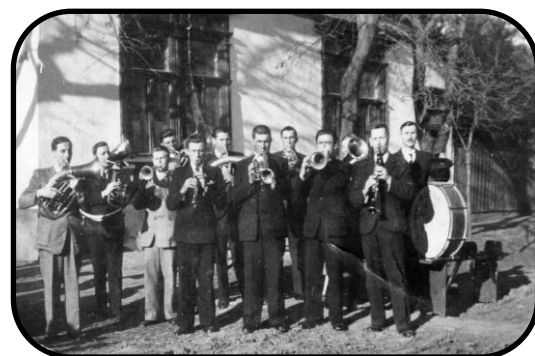
Hudobníci apoštolskej viery v roku 1946