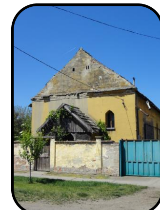
Modlitebňa v minulosti a v súčasnosti