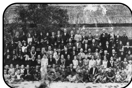
Stretnutie verícich na Pitvaroši (30. roky)