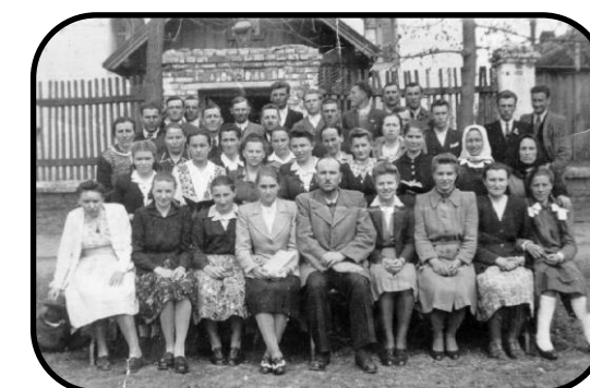
Vyznávači apoštolskej viery pred modlitebňou