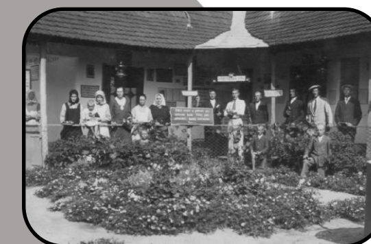
Vyznávači apoštolskej viery