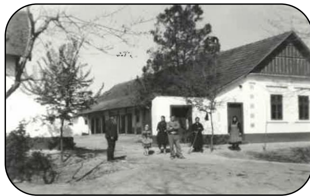
Ondrusov dom na Pitvaroši na Veľkej ulici.