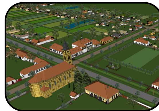
Centrum Pitvaroša v 40. rokoch 20. storočia, počítačový model