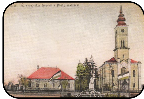
Pohľadnica s farou a evanjelickým kostolom, začiatok. 20. storočia