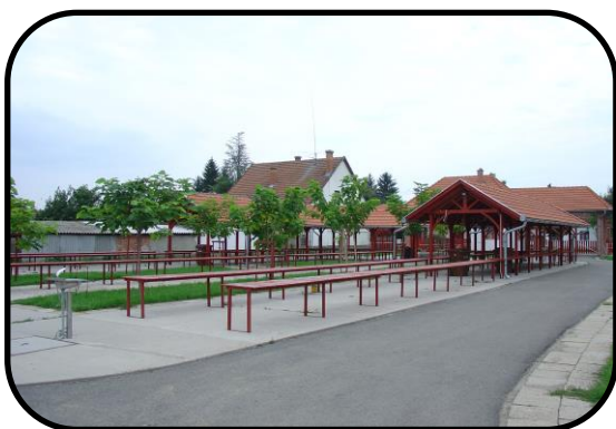
Trhovisko v záhrade evanjelickej fary, rok 2005