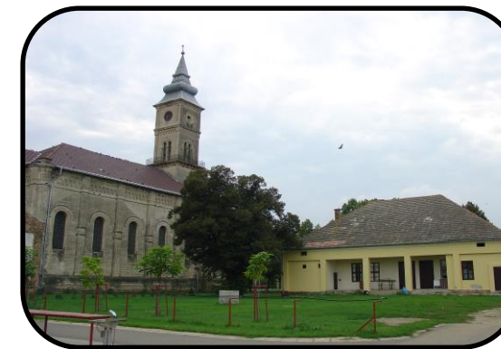
Pohľad na kostol a faru z roku 2005