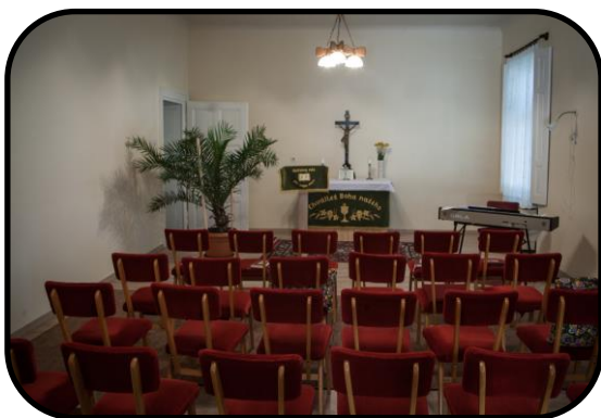
Modlitebňa na fare, rok 2016