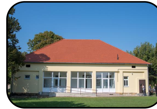
Fara po rekonštrukcii v roku 2018