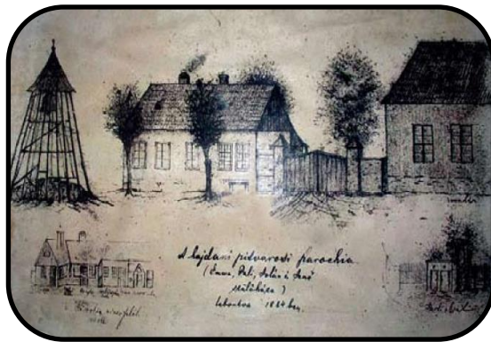
Nákres prvej pitvarošskej modlitebne, fary a zvonice