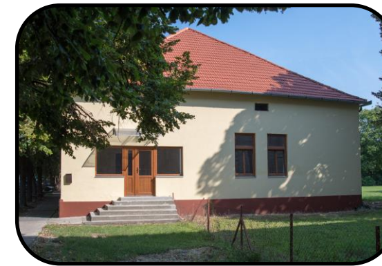
Bočný vstup na faru slúžil v minulosti ako obchod