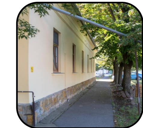
Predná fasáda fary po rekonštrukcii v roku 2018