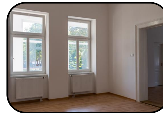
Interiér fary po rekonštrukcii v roku 2018