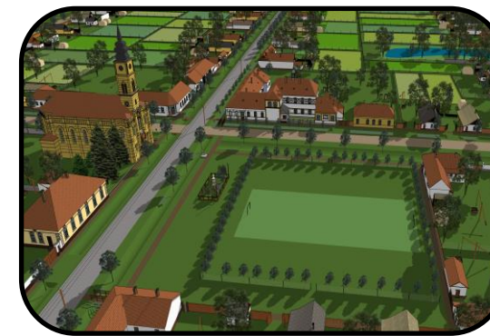
Centrum obce Pitvaroš v 40. rokoch 20. storočia, v strede pľac a futbalové ihrisko