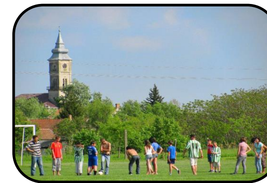
Futbalové ihrisko za obcou v súčasnosti, v pozadí veža evanjelického kostola