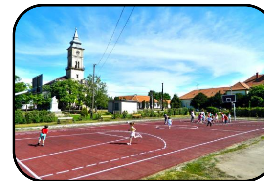
Ihrisko v strede obce po rekonstrukcii, v súčasnosti