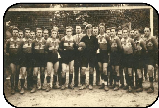
Pitvarošskí futbalisti na ihrisku (20-30. roky 20. storočia)