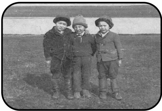
Malí pitvarošskí futbalisti na pažití