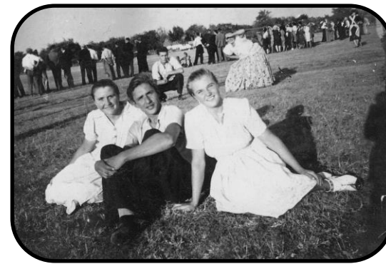
Pitvarošská mládež ako diváci na futbalovom zápase v 40. rokoch 20. storočia