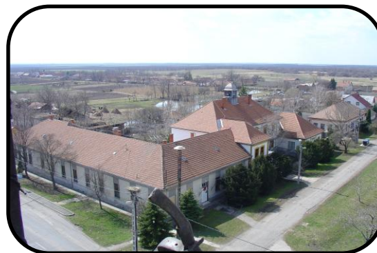
Pohľad z „túrnej“ kostola na školu a v pozadí pitvarošská „úvoda“ v roku 2005