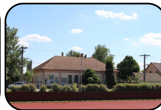
Budova „úvody“ v roku 2015