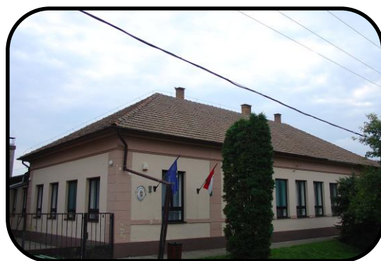
Budova „úvody“ v roku 2005