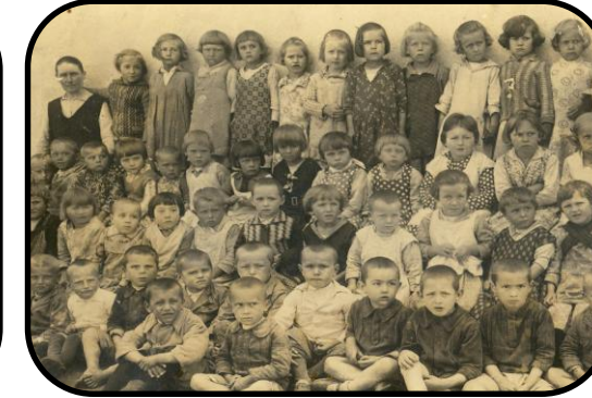
Fotografia z materskej školy z roku 1932