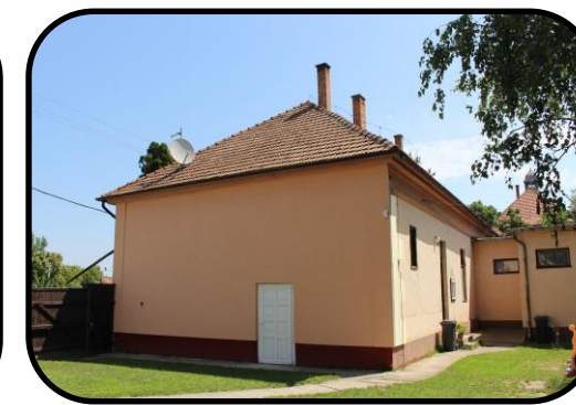
Pohľad na zadnú časť budovy „úvody“ s vchodom v roku 2016