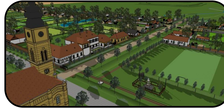
Umiestnenie „úvody“ (okrová budova v strede) v centrálnej časti Pitvaroša