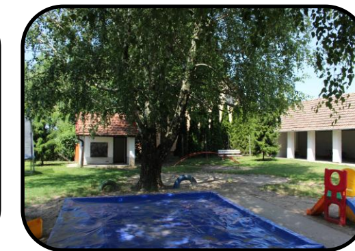
Dvor „úvody“ v roku 2016