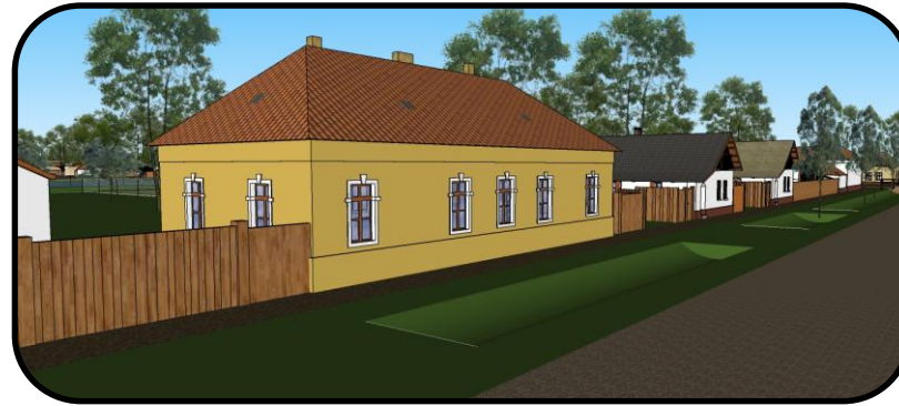
Kostolná ulica, v popredí „úvoda“