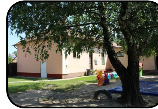
Dvor „úvody“ v roku 2016