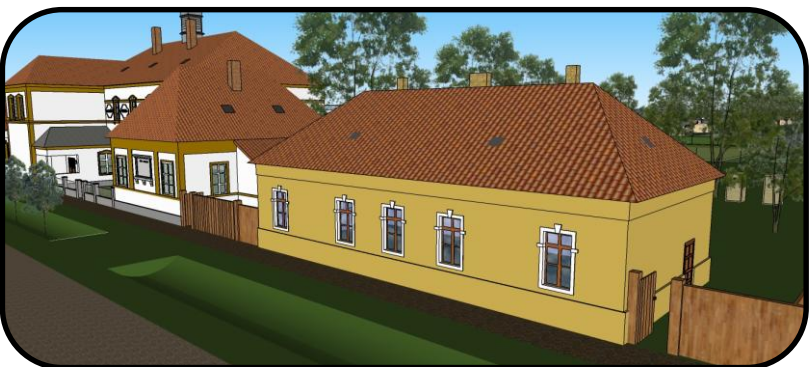
Pitvarošská „úvoda“, vedľa nej budova školy